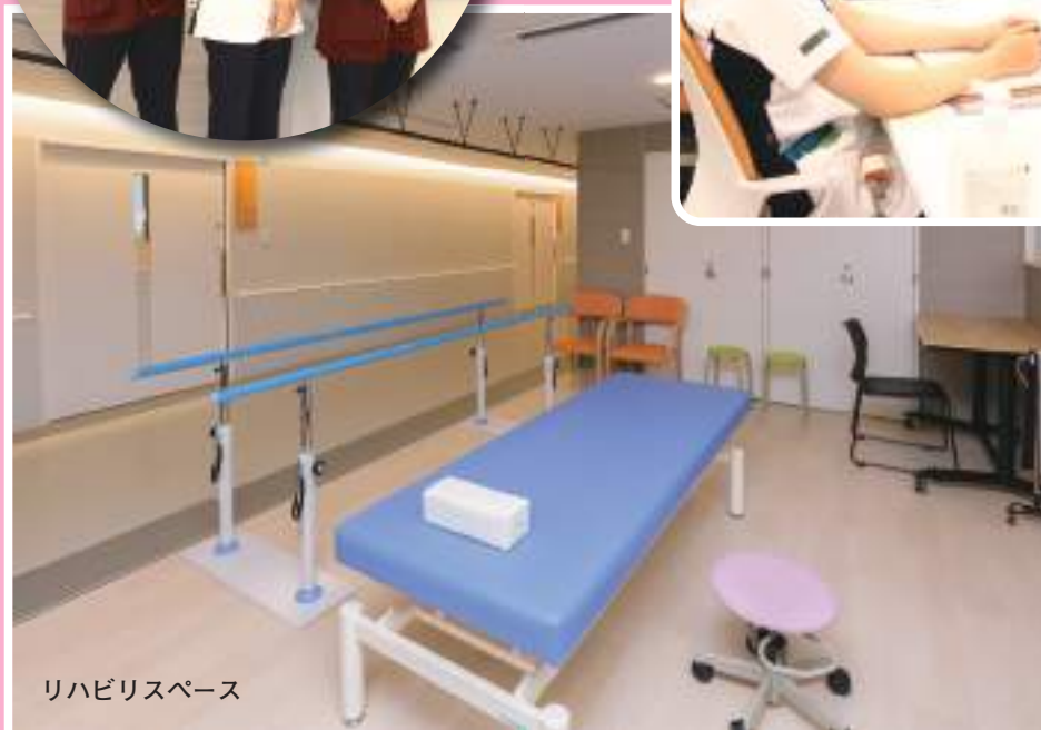
リハビリスペース

病棟内には、リハビリスペースがあります。患者様の早期社会復帰に向け家事動作などの生活動作の獲得ができるよう理学療法士、作業療法士と連携を取りながら様々なリハビリを行っています。