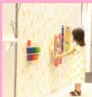
おもちゃ2ギャラリー